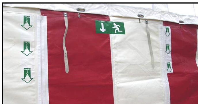
Figur 2.1 Mærkning af udgang og lynlås.

Udgange, der ikke anvendes i den normale drift af teltet, vil typisk være lukket med lynlås. Dette kan accepteres, såfremt lynlåsen er funktionsduelig og letløbende, og at der ved udgangen findes en afmærkning, der viser, hvor lynlåsen er placeret, og i hvilken retning den løber f.eks. som vist på nedenstående figur.