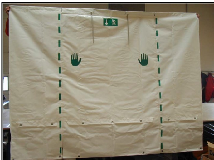
Figur 2.2 Udgang med velcrobånd.

Endelig kan der også anvendes gående døre. Kravet til dørene er de samme som til de øvrige udgange, og det skal derudover sikres, at dørene åbner i flugtvejsretningen, hvis forsamlings-teltet anvendes af flere end 150 personer.